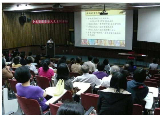
圖 2：現場觀眾認真聆聽

會就醫的患者多半症狀已經影響到日常生活或是社交。妥瑞症的診斷主要是依靠父母或醫生進行長期且仔細觀察才能判定。許多妥瑞症患者會有家族遺傳傾向，但症狀輕重不一。值得注意的是妥瑞症不具傳染性，只是當患者遇到壓力、緊張或疲憊時症狀可能會變得嚴重、或是有新症狀會取代舊症狀。當病患精神放鬆、有良好的同儕關係以及正向的自我評價，則可以減緩症狀。比 tics 更需要注意的是妥瑞症的共病症，如強迫症、注意力缺陷過動症、情緒障礙、學習困難、行為問題（自我傷害行為、反社會行為）、睡眠障礙...等，這些共病症帶來的傷害和影響有時比妥瑞症更加嚴重。妥瑞症是終其一生的疾病，但環境因素的影響會減輕此症狀，且多數人隨年齡增長，會愈來愈懂得掩飾或修飾症狀。